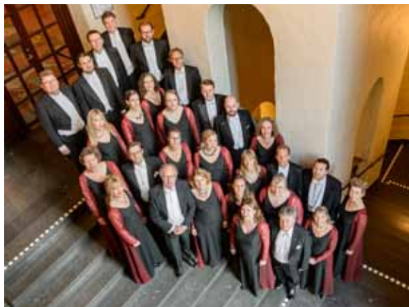
Eric Ericsons Kammarkör